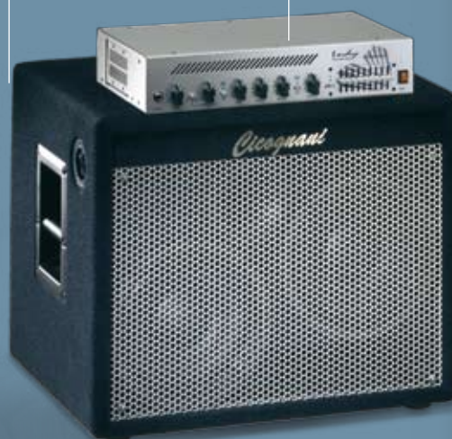
INDY BASS AMP 400H